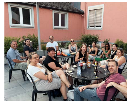
Praxisblicke in Bauprojekte waren beim Lehrgang Immobilien wichtig. Danach genoss man einen Apéro auf der schönen Terrasse der HKV.