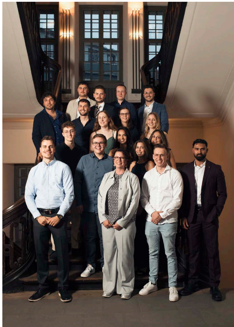
Die erfolgreichen Diplomandinnen und Diplomanden der HFW 2025