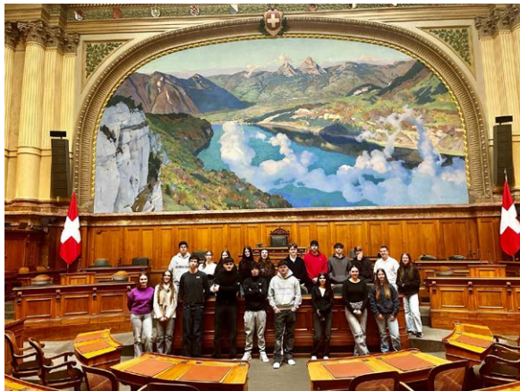
Besuch Bundeshaus in Bern, Februar 2025

Nebst diesen anspruchsvollen Arbeiten durften wir auch schöne Ereignisse erleben. Unsere Schule nahm erneut an der jährlich stattfindenden Berufsmeisterschaft teil und dank der grossen Initiative unserer Lehrpersonen profitierten verschiedene Klassen von spannenden Ausflügen und Projekten. So reisten einige Klassen nach Bern, wo sie das Bundeshaus besuchten, die eindrücklichen Räumlichkeiten besichtigten und sogar aktiv eine eigene Debatte führten. Eine andere Klas-