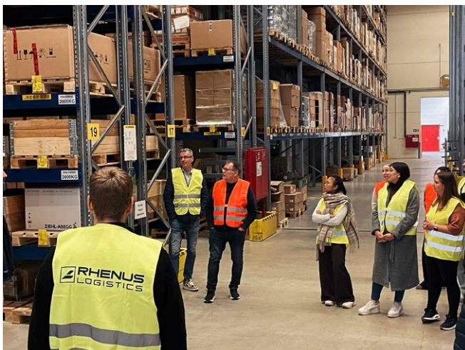
HFW-Klasse im 3. Semester auf dem Rundgang bei Rhenus Logistics