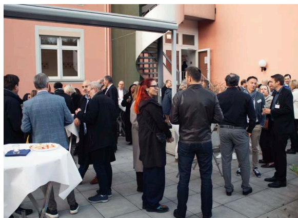
Gemeinsamer Austausch an der Frühjahrstagung der Rektorenkonferenz in der HKV Handelsschule KV Schaffhausen

Die Planung und Durchführung der Qualifikationsverfahren EFZ und EBA sowie die Organisation der Schlussfeier 2025 erfolgten in enger Zusammenarbeit mit der Prüfungsadministration.