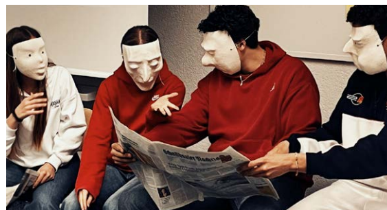
Projekt Masken im Theater Mai 2025